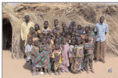
Projet en cours : construction d'une école à Baou, village en brousse. Ci-dessus la classe dans les conditions de scolarité actuelles.